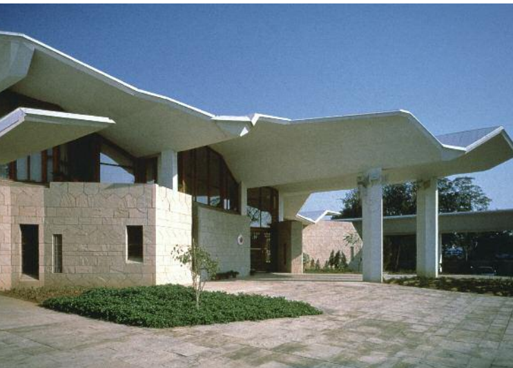
Ambassade de Finlande à New Delhi

En Finlande, Reima Pietilä était pionnier, il représentait une avant-garde authentique, même si l'on n'avait pas compris cela pendant sa vie. Toutefois, son avant-garde était - et est - plutôt d'une qualité philosophique ou spirituelle que de quelque chose d'étroitement liée aux formes architecturales. J'ai dit spirituelle, parce qu'elle exprime intuition créative et liberté. Cette liberté n'est pas arbitraire mais plutôt se lie à la culture et à la nature, c'est à dire au contexte local à travers une pensée conceptuelle consciente. L'architecture de Pietilä ne peut être imitée, mais on peut véritablement apprendre de sa méthode et de son approche architecturale. Tous ceux qui font du travail créatif peuvent en tirer inspiration pour leur propre manière de travailler.