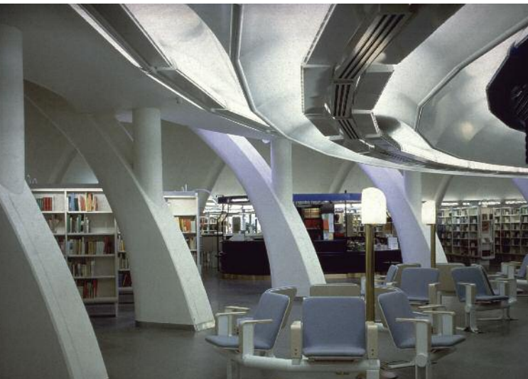
Metso, Bibliothèque principale de la ville de Tampere

Je pense que c'est spécifiquement dans le cas de Reima Pietilä que l'on voit émerger le problème herméneutique de l'écriture de l'histoire de l'architecture du XX ème siècle. Peu d'auteurs ont voulu ou osé ou même été capables de le situer dans la matrice du développement architectural des dernières décennies. Je pense qu'il n'y a pas de raison pour ce genre d'inspiration. Il s'agit plutôt d'un manque de connaissance approfondie ou bien d'un malentendu. A présent, plus d'un quart de siècle après sa mort, le point me paraît très clair en termes d'histoire de l'Architecture moderne. Néanmoins, il reste beaucoup à explorer, et l'Architecture des Pietilä est une véritable mine d'or pour la recherche. Dans mon présent livre, j'ai essayé de créer un portrait concis de Reima Pietilä, en mettant un accent particulier sur sa pensée architecturale, ses méthodes de travail et la signification de son œuvre.