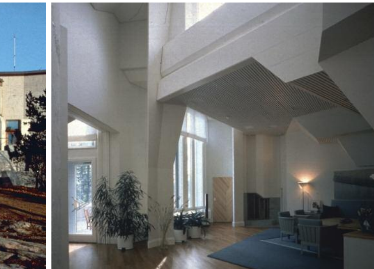
Mäntyniemi, résidence officielle du président de la Finlande à Helsinki

A propos de la théorie d'archétypes, il est possible de distinguer des "archétypes universels" spécifiques à l'être humain (étudiés, notamment, par Carl Gustav Jung) ; et, d'autre part, il est aussi possible de parler des "archétypes culturels" qui se limitent à la culture d'une certaine société ou communauté. Ce sont en fait des formations de valeurs culturelles qui se développent à travers des siècles dans la mémoire collective et se manifestent symboliquement dans le domaine culturel, notamment en architecture ; je les ai appelés "archétypes culturels".