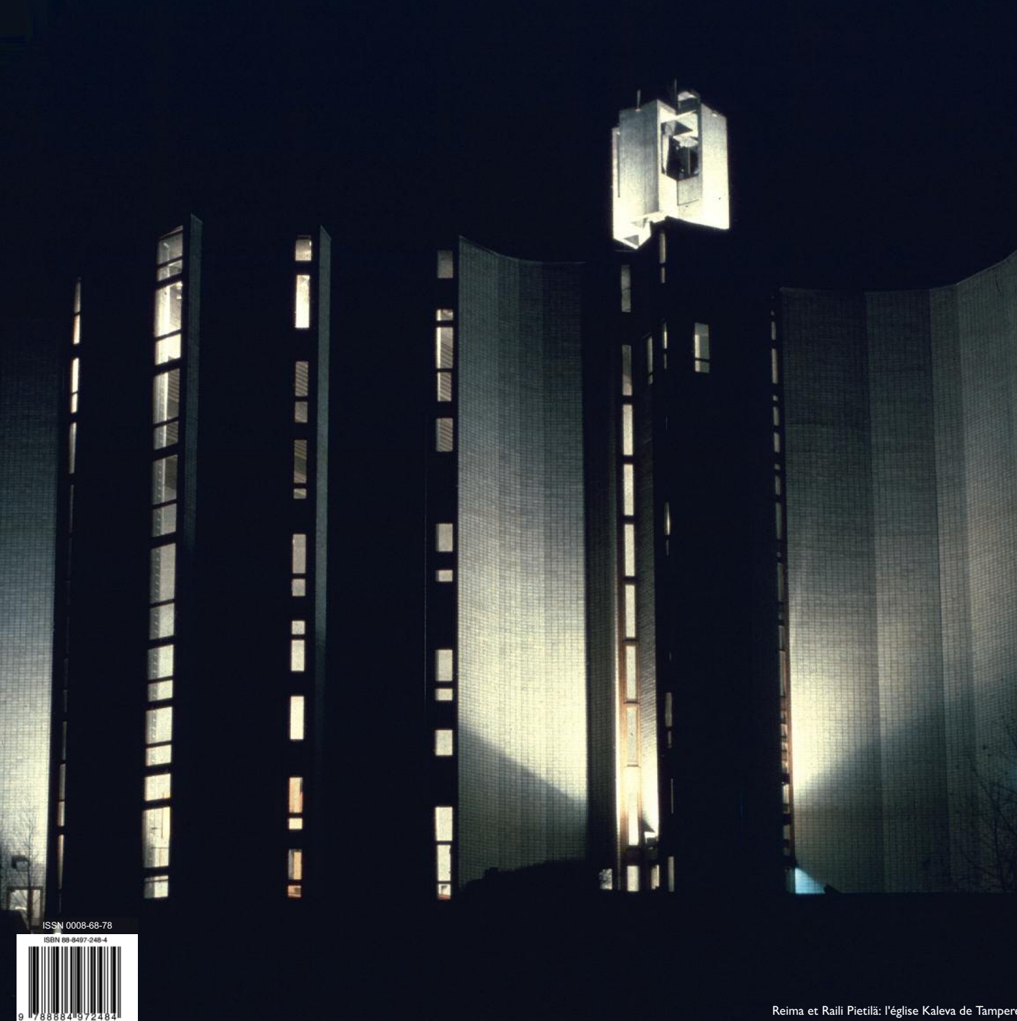
Reima et Railii Pietilä: l'église Kaleva de Tampere

Ainsi, les premiers sont communs à toute l'humanité, ce sont des structures psychiques du subconscient collectif. Les seconds sont liés à la mémoire collective, c'est-à-dire aux structures profondes d'une culture, comme, par exemple, les valeurs éthiques ou esthétiques, et leurs manifestations symboliques dans le domaine culturel. Je dirais qu'une architecture culturellement durable est toujours fondée sur des archétypes culturels.